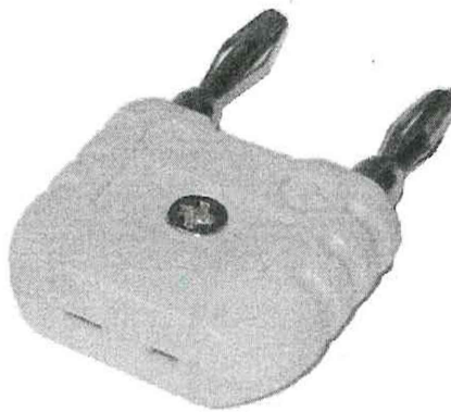
Рисунок 2 – Адаптер TC-to-banana